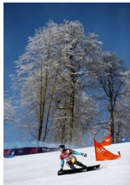
Sochi 2014 Slalom géant parallèle (F)