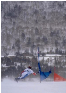
Nagano 1998 Slalom géant parallèle (H)