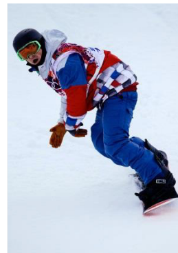
Sochi 2014 Half-pipe (H)