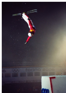
Turin 2006 Saut (F)