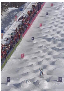
Lillehammer 1994 Bosses (F)