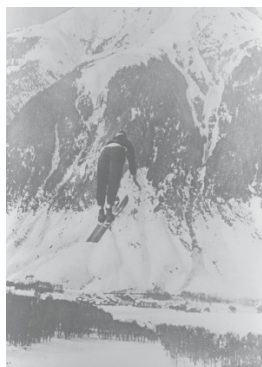
Chamonix 1924 Tremplin normal (H)