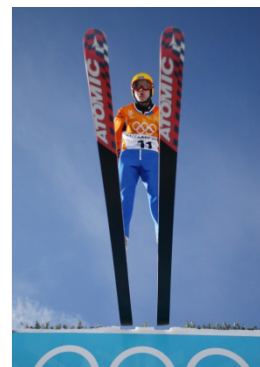
Salt Lake City 2002 Grand tremplin (H)