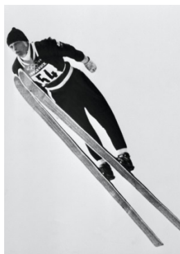
Innsbruck 1964 Tremplin normal (H)