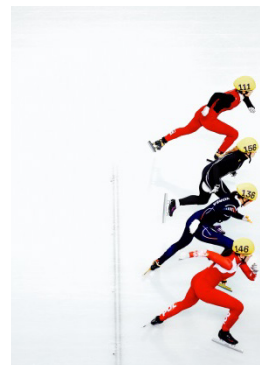
Sotchi 2014 1000m (F)