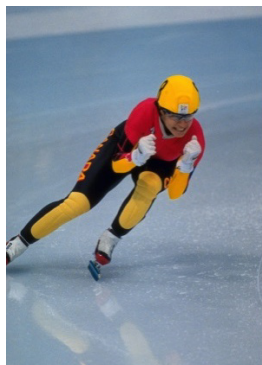
Nagano 1998 500m (F)