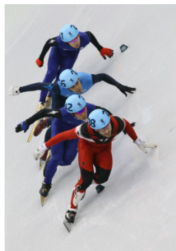
Vancouver 2010 500m (H)