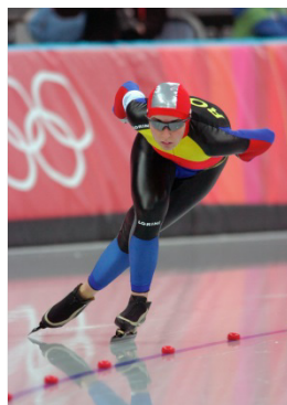
Turin 2006 1500m (F)