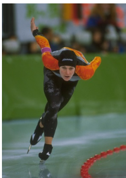
Lillehammer 1994 5000m (F)