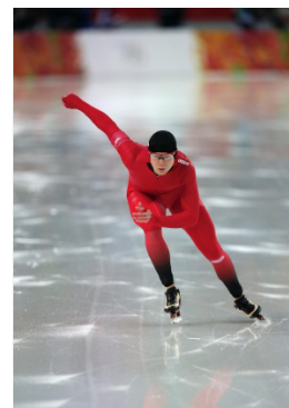
Sochi 2014 1500m (H)