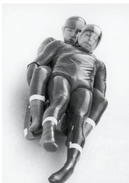
Sarajevo 1984 Double mixte (X)