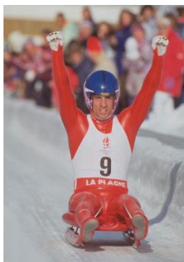
Albertville 1992 Simple (H)