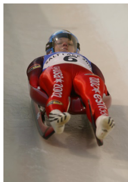
Salt Lake City 2002 Simple (F)