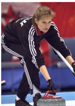
Nagano 1998 Curling (F)