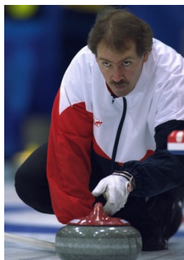
Nagano 1998 Curling (H)