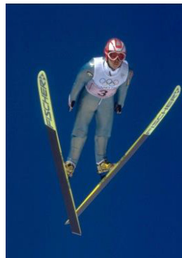
Nagano 1998 Équipes (H)