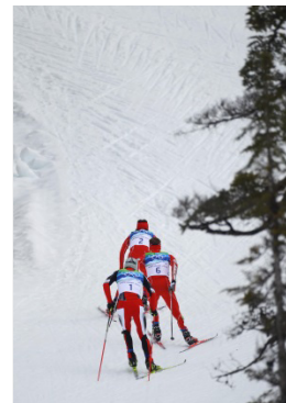
Vancouver 2010 Individuel (H)