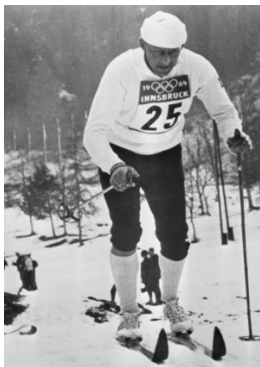
Innsbruck 1964 Individuel (H)