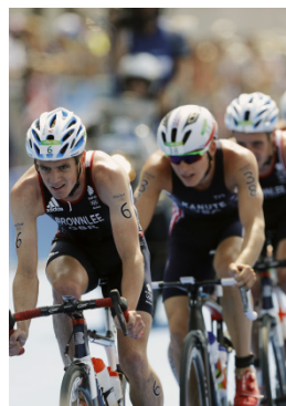
Rio 2016 Triathlon (H)