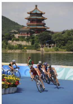
Beijing 2008 Triathlon (F)