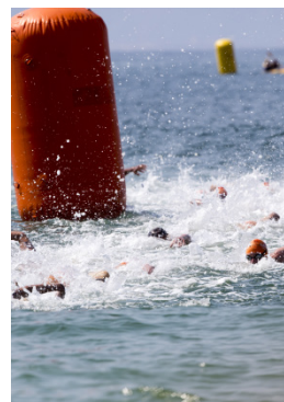
Rio 2016 Triathlon (H)