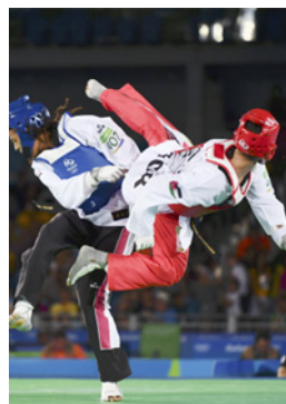
Rio 2016 Taekwondo (H)