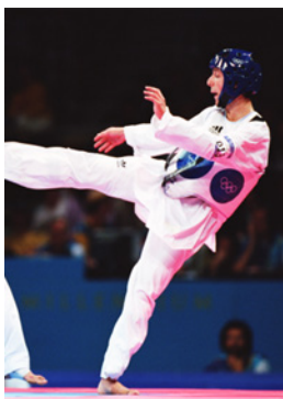
Sydney 2000 Taekwondo (H)