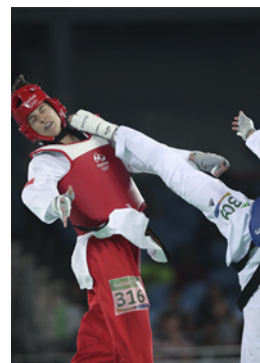
Rio 2016 Taekwondo (F)