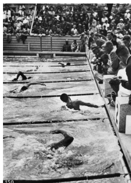
Berlin 1936 400m nage libre (H)