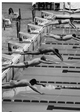
Mexico 1968 1500m nage libre (H)