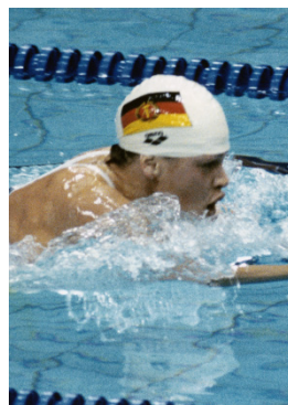
Seoul 1988 200m brasse (F)