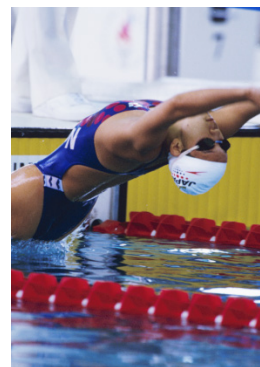
Atlanta 1996 100m dos (F)