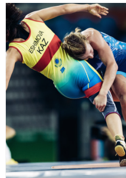
Rio 2016 48kg (F)