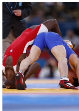
Londres 2012 -55kg (H)