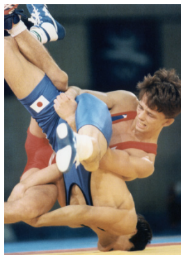
Barcelone 1992 48-52kg (H)