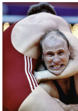
Séoul 1988 -82kg (H)