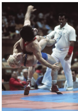
Montréal 1976 -57kg (H)