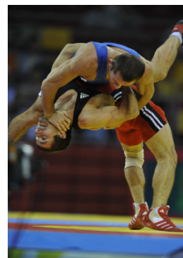
Beijing 2008 -60kg(H)