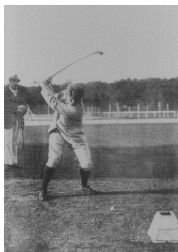
Paris 1900 Golf (H)