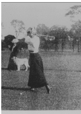
Paris 1900 Golf (F)