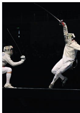
Beijing 2008 Sabre (H)