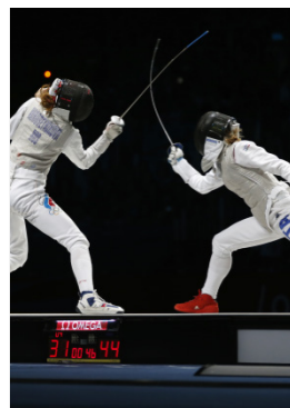
Londres 2012 Epée par équipes (H)