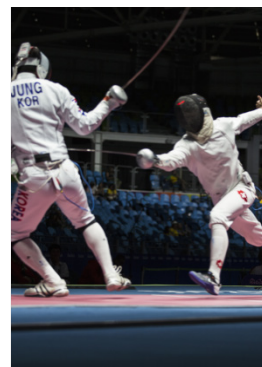
Rio 2016 Fleuret par équipes (H)