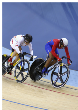
Londres 2012 Sprint (F)