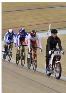
Beijing 2008 Keirin (H)