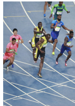
Rio 2016 4x100m (H)