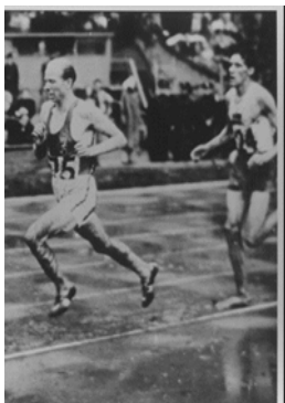
Londres 1948 5000m (H)