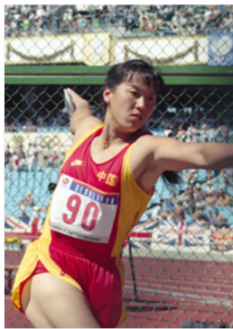
Séoul 1988 Lancer de disque (F)