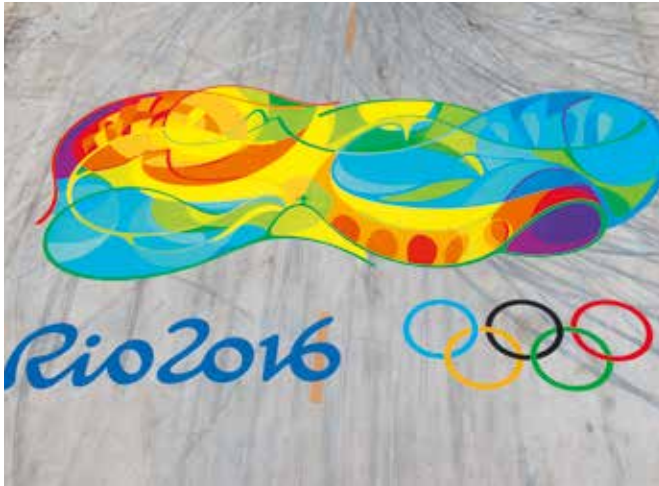
Le look des Jeux.

L'identité visuelle de Rio 2016 repose sur les quatre piliers suivants :