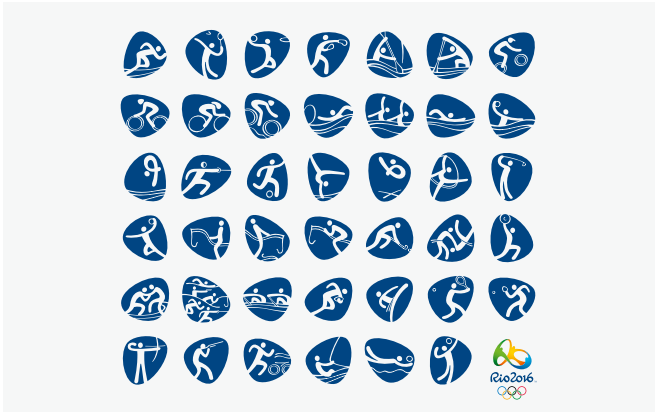
Les pictogrammes de Rio 2016.

Les JO de Rio vont célébrer le retour de deux sports : le golf et le rugby, disparus du programme en 1904, pour l'un et en 1924, pour l'autre.