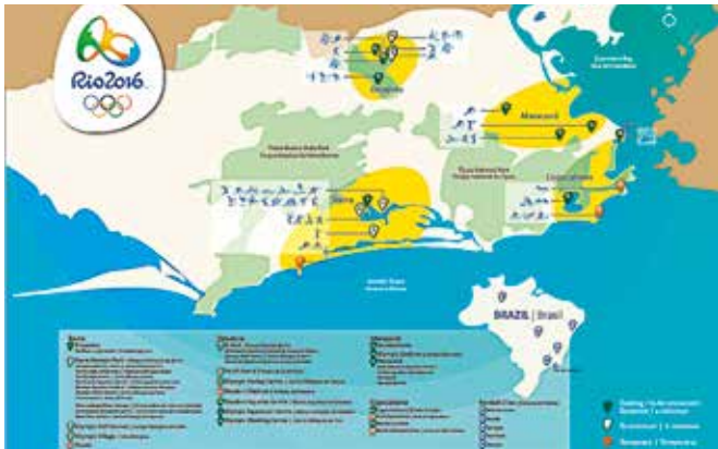
Plan du site.

Nouvelles installations pour les activités sportives et culturelles