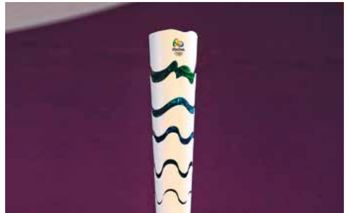
La torche de Rio 2016.

La torche de l'édition de 2016 est composée de différents segments qui se séparent, lors de la transmission de la flamme, révélant les couleurs du Brésil.