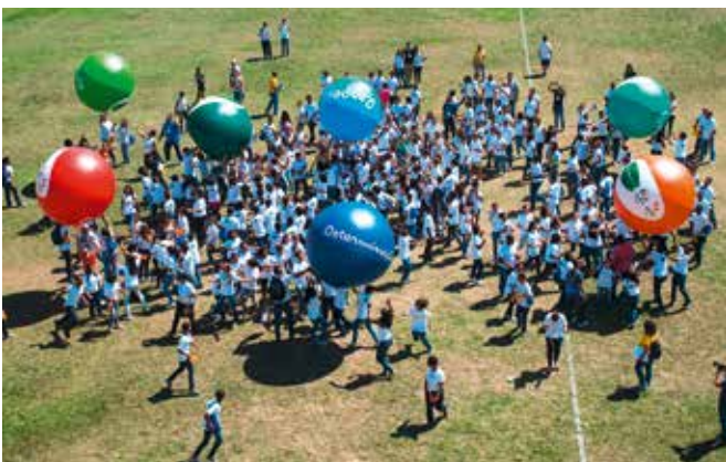
Une activité du programme d'éducation « Transforma ».

Inspirer la jeunesse et renforcer l'offre sportive