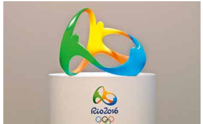
L'emblème de Rio 2016.

L'emblème des Jeux est composé de trois silhouettes colorées qui se touchent comme dans une ronde joyeuse, pour former un tout.