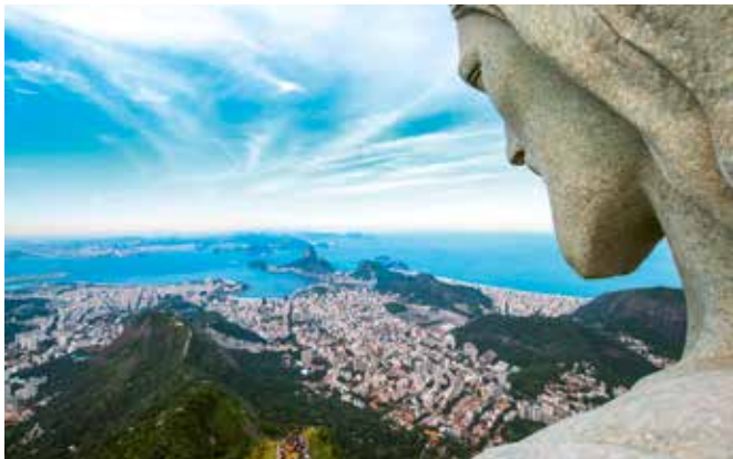
La ville de Rio depuis le sommet du Pain de Sucre.

Le relais de la flamme olympique relie, symboliquement, les Jeux de l'antiquité et ceux de l'ère moderne.