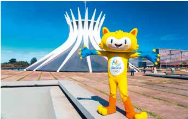
La mascotte Vinicius.

Officialisée en 1972, la mascotte olympique est un emblème populaire, qui matérialise l'esprit olympique et célèbre l'histoire et la culture du pays ou de la ville hôte. Pour les Jeux Olympiques de 2016, la mascotte s'appelle Vinicius .